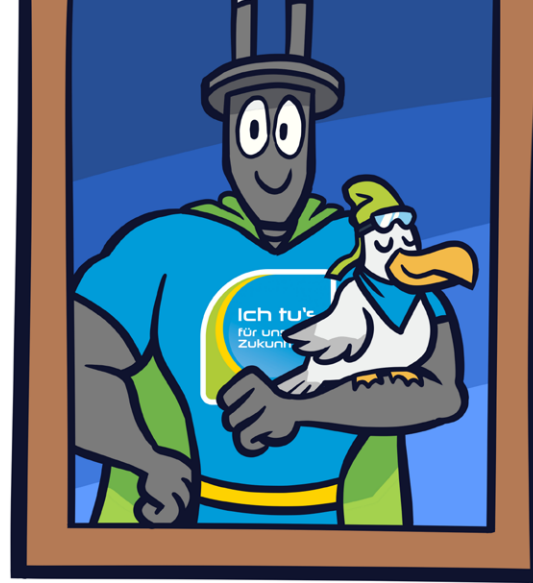
Stektor und KliMax