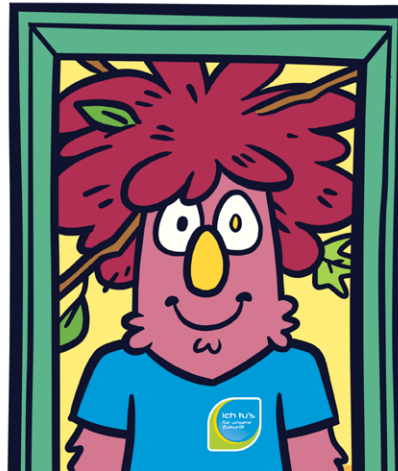
Der Klima- checker